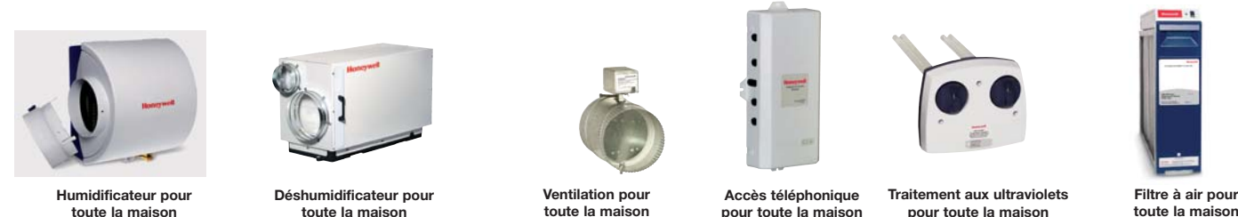
Humidificateur pour toute la maison

Bornes distinctes pour capteur intérieur/extérieur — Permet de capter simultanément la température extérieure et la température ambiante.